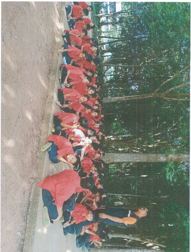
กิจกรรมคัดเลือกนักเรียนแกนนำ อบรมโครงการโรงเรียนปลอดบุหรี่ไฟฟ้า