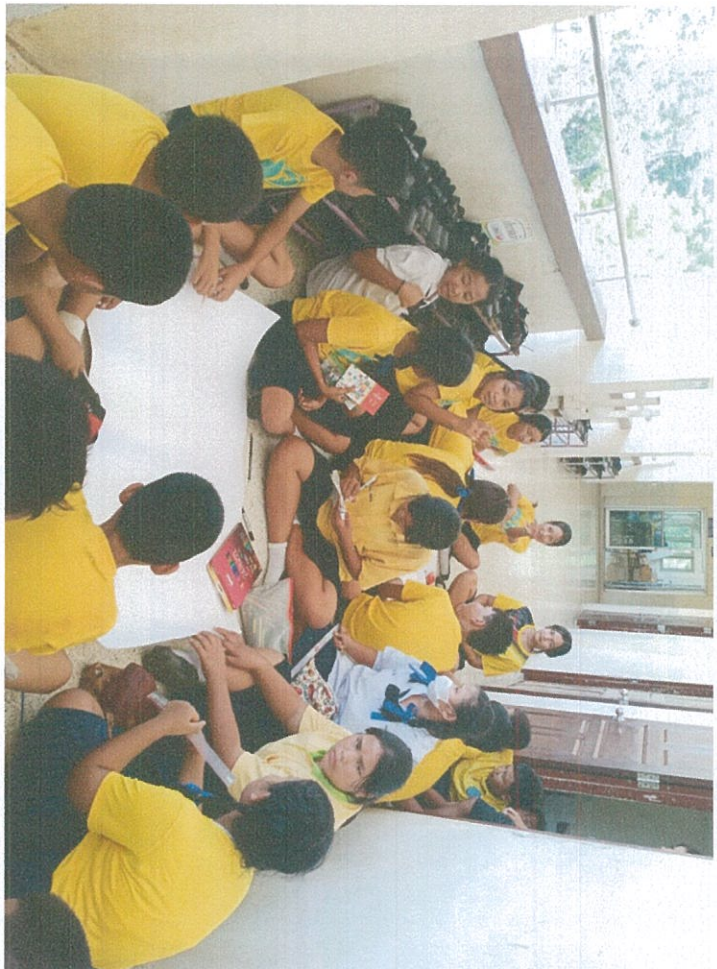
กิจกรรมกลุ่มสัมพันธ์